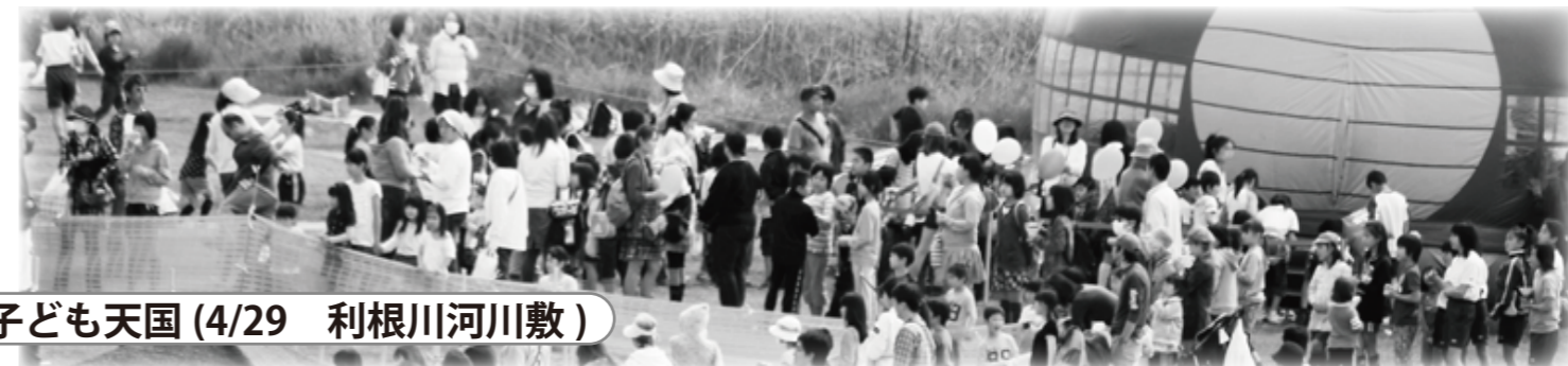
子ども天国 (4/29 利根川河川敷)